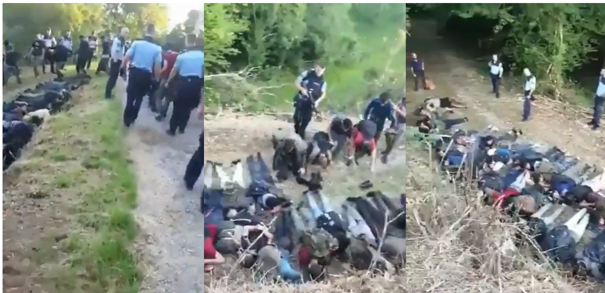
Kolektivni izgon na Hrvaško iz okolice Ilirske Bistrice, 19.7.2019.

Glede na nerealen čas obravnave in depešno poročilo je razvidno, da so bile prijete osebe obravnavane kolektivno in bile nato tudi kolektivno izgnane na Hrvaško. V postopku je zgolj 8 oseb po poročilu policije zaprosilo za mednarodno zaščito. Dodatno zaskrbljujoče informacije vsebuje pričevanje oseb, ki so bile po predaji na Hrvaško izgnane v BiH.