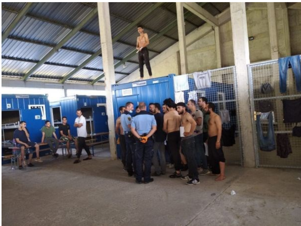
Protest v Centru za tujce v Postojni, 28.7.2020.

dopustili, da bi nam odvzeli dostojanstvo. Zahtevamo spoštovanje svojih pravic! Zahtevamo svobodo gibanja!" 30